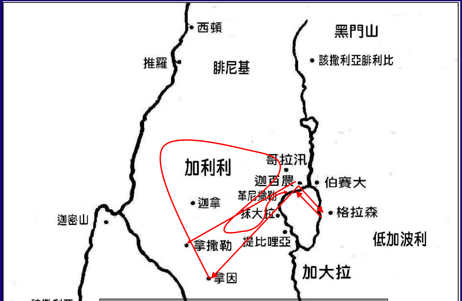
基督在加利利第二次遊行傳道行蹤圖