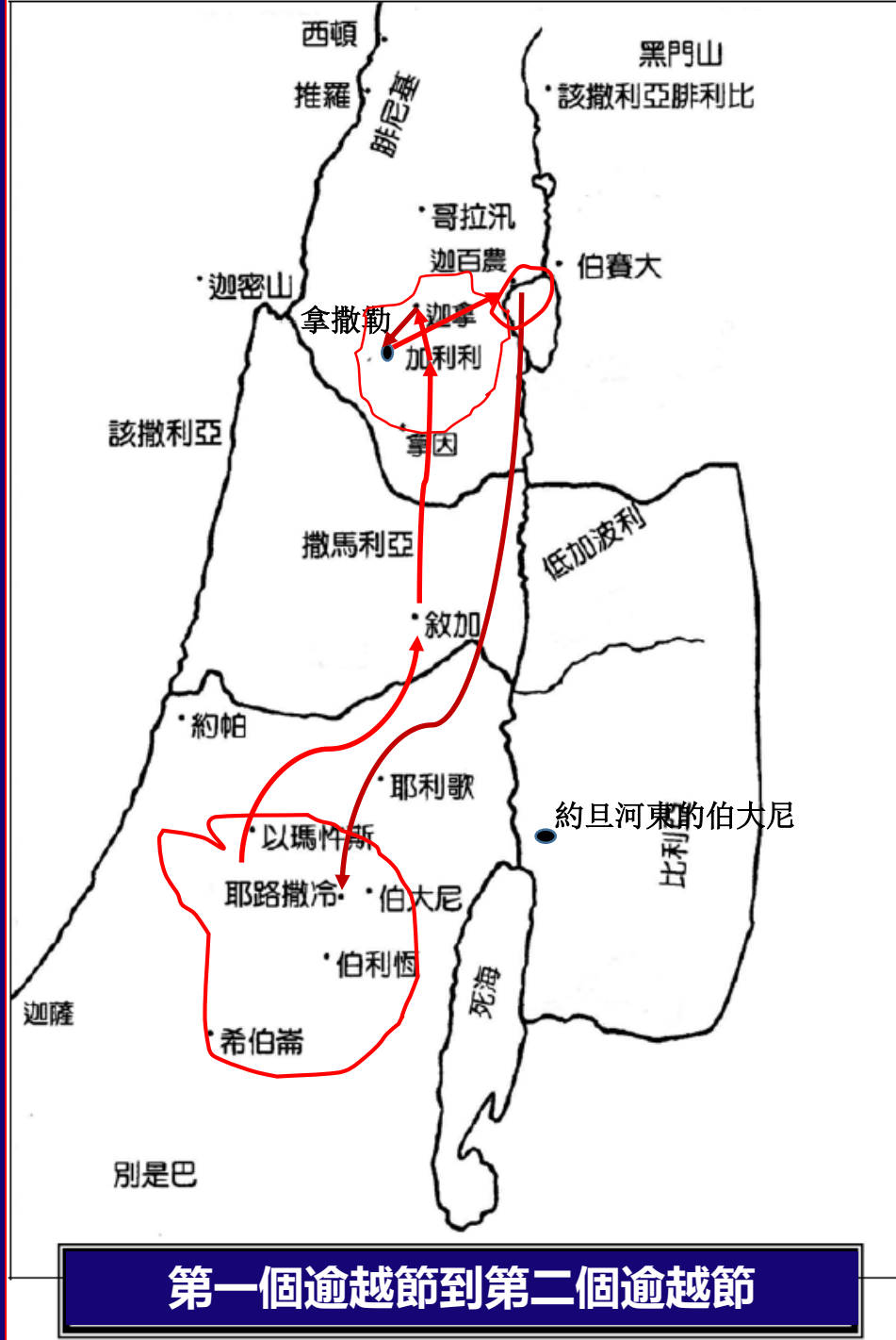
第一個逾越節到第二個逾越節