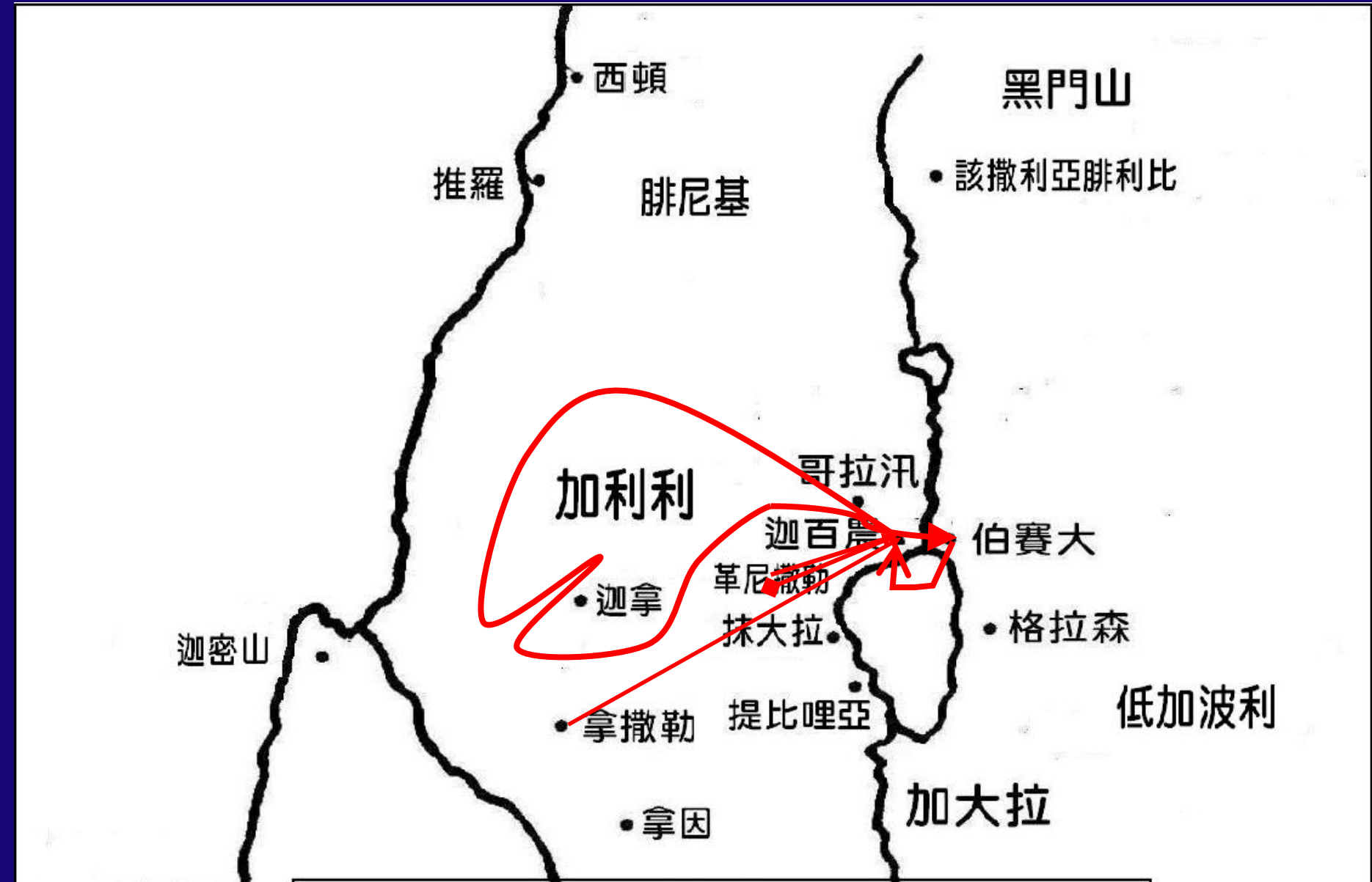
基督在加利利第三次遊行傳道行蹤圖