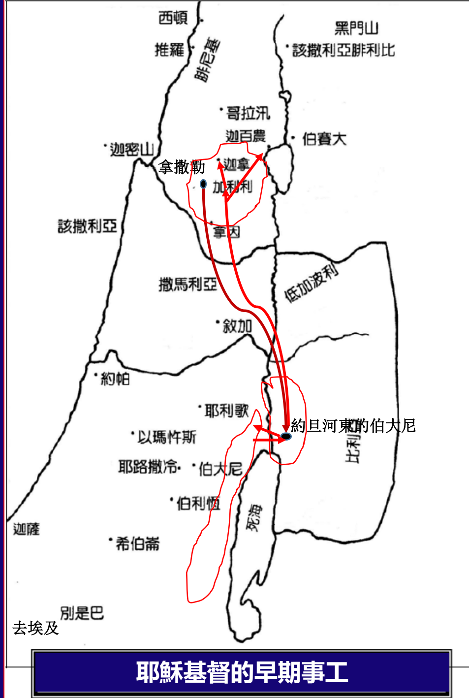
耶穌基督的早期事工