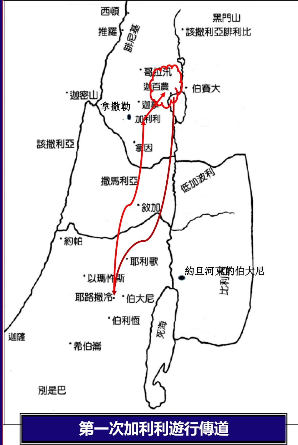
第一次加利利遊行傳道