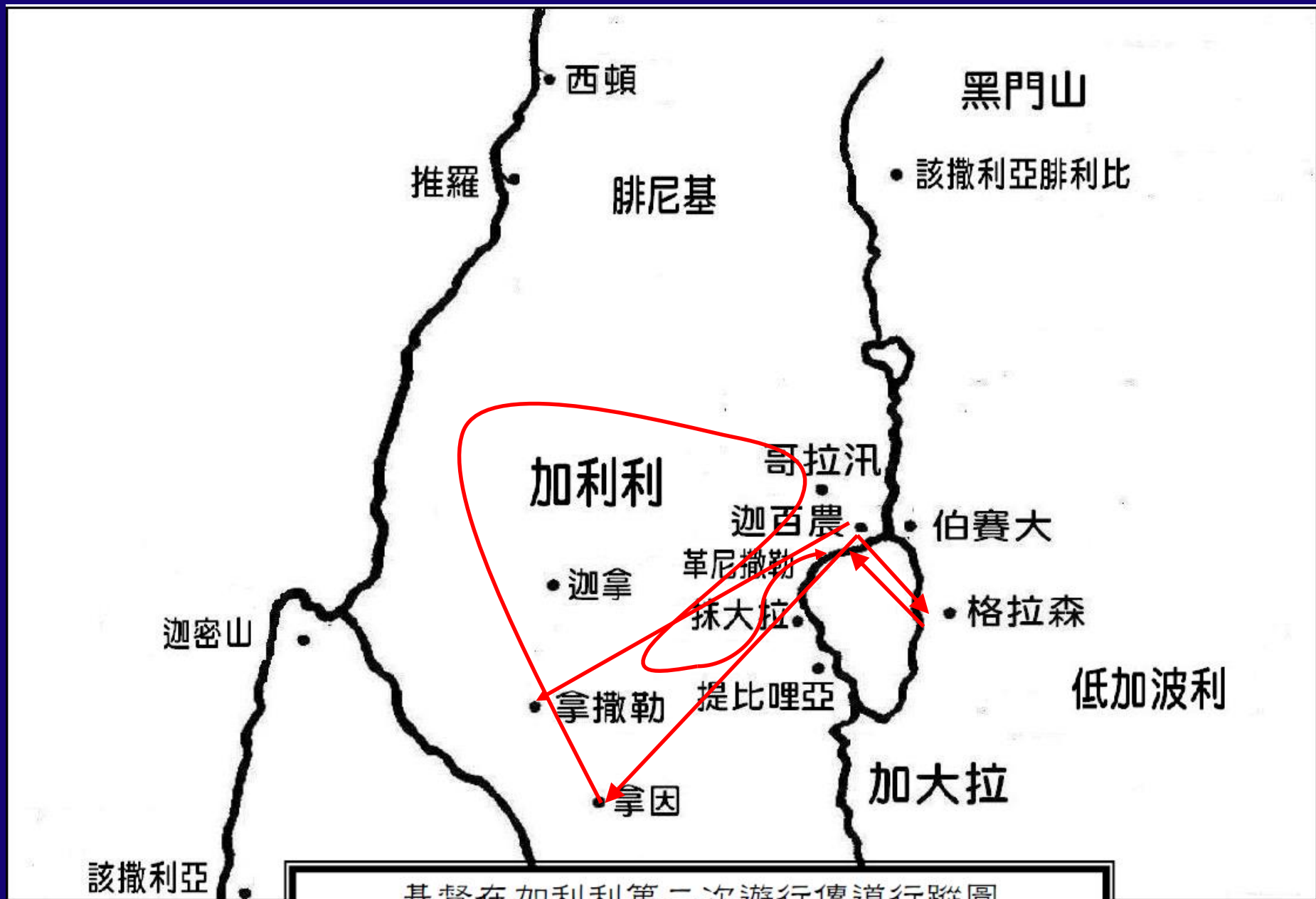
基督在加利利第二次遊行傳道行蹤圖