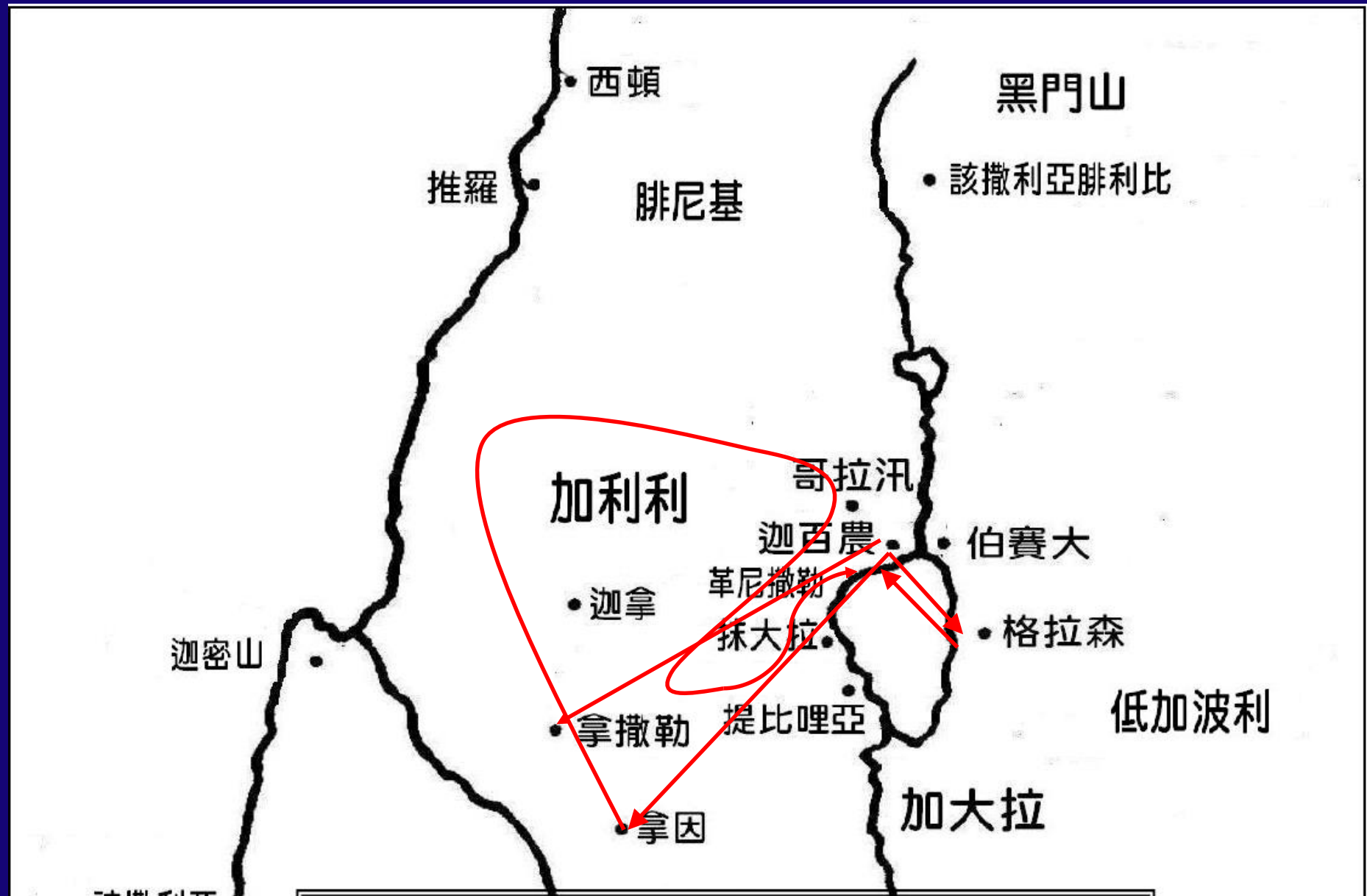
基督在加利利第二次遊行傳道行蹤圖